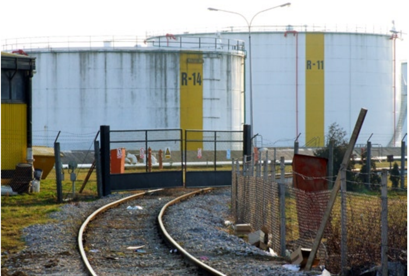
Slika 4. - Industrijski kolosijek prema skladištima tvrtke »Tifon« u Zaboku.

No, problemi se pojavljuju zbog toga što će kolosijek uskoro trebati temeljito obnoviti ili će stati promet po njemu. Vlasnik kolosijeka je ciglana koja zapošljava 79 radnika i znatan je generator zaposlenosti i proizvodnosti u manjoj regiji. Planovi ciglane jesu u širenju proizvodnje i u povećanju količine otpreme željeznicom. Kao takva zaslužuje pozornost mjesnih i državnih vlasti, i svakako bi joj se trebalo pomoći pri osuvremenjivanju vlastite prometne infrastrukture.