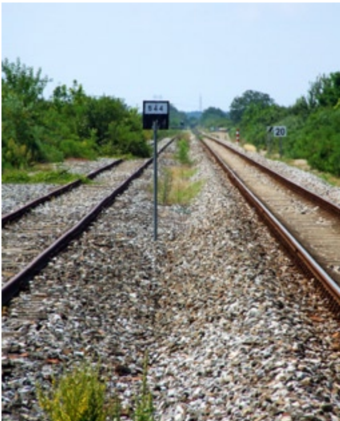
Slika 7. - Kolosijeci bivšeg transportnog otpremništva "Đergaj"

U današnje vrijeme između ceste Vukovar - Vinkovci i već spomenute pruge i »Vupikova« silosa rezerviran je prostor za manju gospodarsku zonu. U njoj djeluju poduzeća »Europa Mill«, »Biogoriva« d.o.o. Vukovar, »CIOS-Reciklaža« i »Berg«, a uskoro će i svoj pogon podignuti tvrtka »Adriatic«. Jedan od razloga nastanka tih gospodarskih subjekata na tome mjestu jest i blizina željezničke infrastrukture. No, problem je u tome što sâm Đergaj nije aktivan već skoro 20 godina, a cijena osuvremenjivanja manipulativnih kolosijeka i izgradnje novih industrijskih kolosijeka do novih poduzeća prilično je visoka. Sva četiri spomenuta poduzeća živo su zainteresirana za otpremu željeznicom. Svoju zainteresiranost potvrdila su u nekoliko navrata slanjem pismenih upita Glavnoj poslovnicu HŽ-Carga d.o.o. u Vinkovcima za prijevoz roba željeznicom 35 .