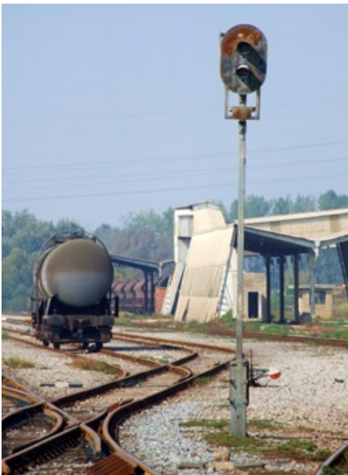
Slika 1. - Pogled na dio industrijske željeznice "Petrokemije d.d." u Kutini