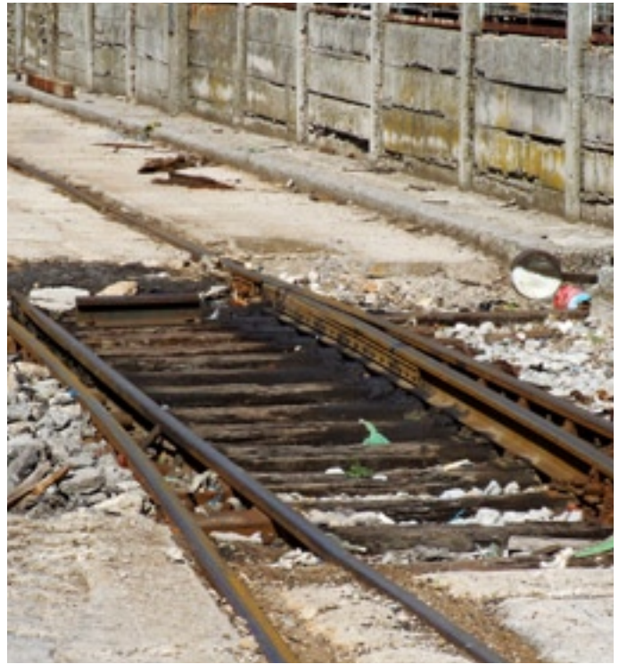
Slika 2. - Loše stanje jedne od skretnica na industrijskim kolosijecima u Luci Rijeka

U gospodarski razvijenim zemljama poduzeća u velikom broju posjeduju industrijske kolosijeka i uglavnom ih iskorištavaju. U manje razvijenim zemljama taj je broj puno manji, a posljedica je lošega planiranja, lošega razvoja gospodarskih područja, lošega planiranja razvoja prometne infrastrukture, lošega planiranja