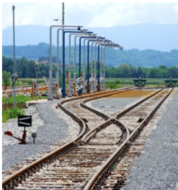
Slika 8. - Pogled na novosagrađene industrijske kolosijেকে tvrtke »Crodux« u Sv. Križu Začretju

Gotove proizvode poduzeće »Schütz« i dalje otprema kamionima jer kupci nemaju vlastitih industrijskih kolosijeka. No, novi trendovi u prijevozu, mogućnost dobivanja subvencija i zakonske odredbe nekima bi od tih kupaca mogli otvoriti mogućnost povoljne izgradnje industrijskih kolosijeka, a »Schütz« je tada spreman i odlučan gotove proizvode početi prevoziti željeznicom.