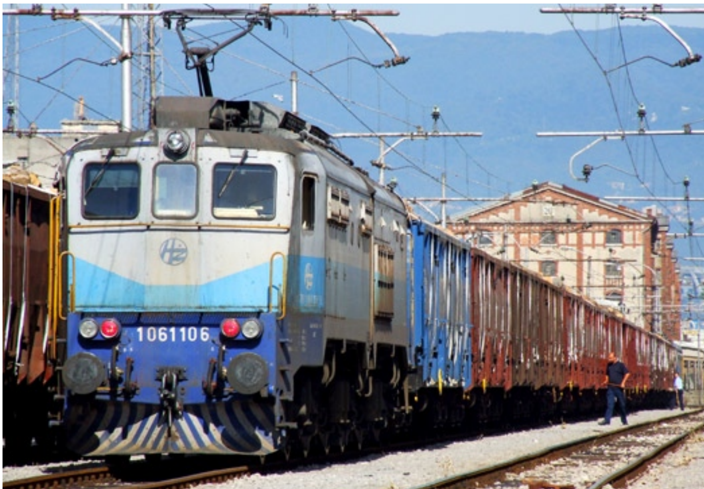
Slika 9. - U pozadini kolodvora Rijeka vidi se dio lučkih zgrada na tzv. "Budimpeštanoskom pristaništu"

pruga može ostati u državnom vlasništvu ili pak u skladu sa Zakonom o željeznici 40 biti predana pod ingerenciju lokalne uprave i samouprave, kao što je to moguće u slučaju pruga važnih za lokalni promet 41 .