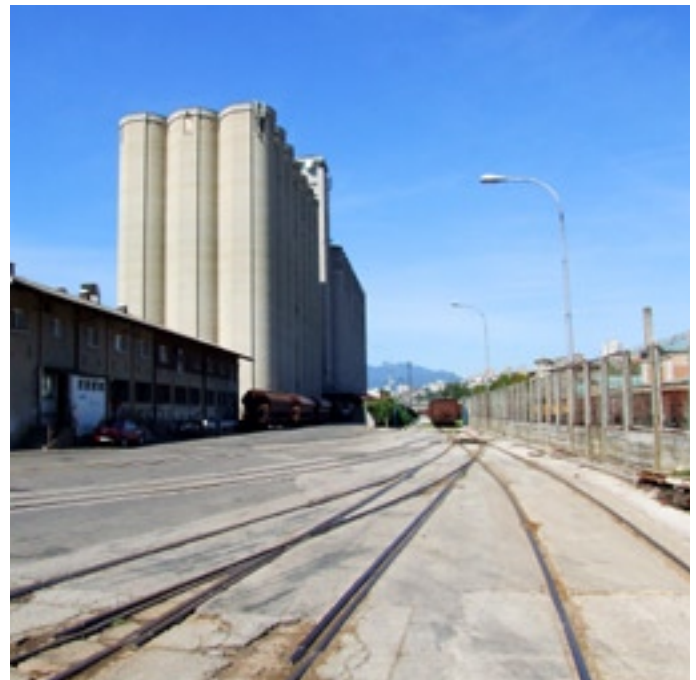
Slika 6. - Silosi u luci Rijeka pokraj željezničkog kolodvora

Kontejnerski i RO-RO-terminal Brajdica željeznicom otprema i doprema samo oko 20 % ukupnog kontejnerskog prometa. Razlog tomu jest to što se većina kontejnera na terminalu otprema i doprema za potrebe komitenata u Hrvatskoj i Srbiji gdje na nerazvijenom prometnom tržištu prevladava uglavnom prijevoz kamionima. Kontejneri koji se odvoze i dovoze iz EU-ovih zemalja gotovo 100 % putuju vlakom. Terminal Brajdica posjeduje mrežu industrijskih kolosijeka koja uglavnom udovoljava postojećem kapacitetu terminala.