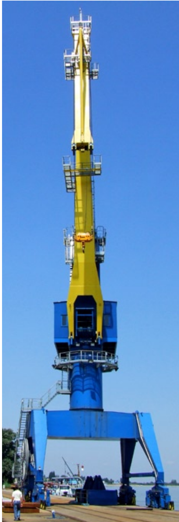
Slika 10. - Jedna od dizalica u luci Vukovar donacija je kraljevine Belgije

Infrastrukturni upravitelj (HŽ-Infrastruktura d.o.o.) određivao bi isplati li se graditi i održavati koji od industrijskih kolosijeka odnosno skupe pružne građevine koje su njegov sastavni dio.