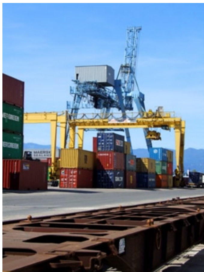
Slika 5. - Kontejnerski terminal Rijeka Brajdica

Prema statistikama Lučke uprave Rijeka 30 na tim se terminalima godine 2008. pretovarilo 6.027.427 tona generalnih i rasutih tereta